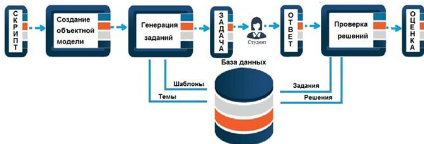
Рис. 3. Общая структура интерактивного сервиса

Проанализировав все необходимые элементы интерактивного сервиса, возможности которого удовлетворяли бы студентов и преподавателей, была составлена следующая структура интерактивного сервиса (рис. 3):